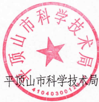
平顶山市科学技术局