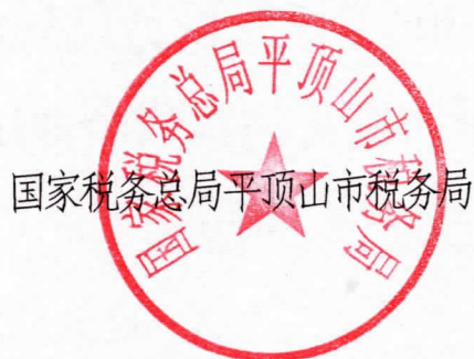
国家税务总局平顶山市税务局