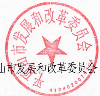
平顶山市发展和改革委员会