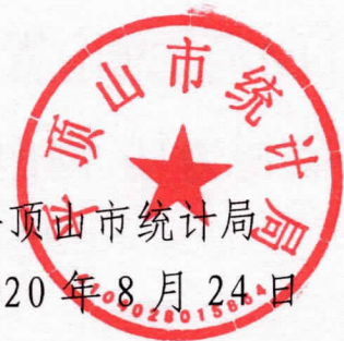
平顶山市统计局 2020年8月24日